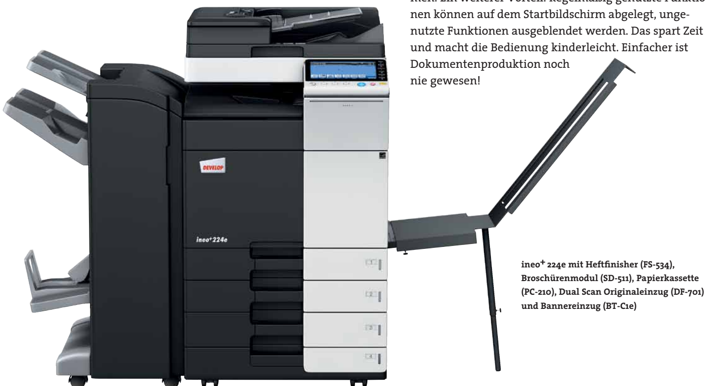
ineo+ 224e mit Heftfinisher (FS-534), Broschürenmodul (SD-511), Papierkassette (PC-210), Dual Scan Originaleinzug (DF-701) und Bannereinzug (BT-C1e)

Viele Multifunktionssysteme sind alles andere als anwenderfreundlich. Doch damit ist nun Schluss – die ineo+ 224e ist für Ihre Anforderungen wie geschaffen. Das Bedienungskonzept ist intuitiv erfassbar und genauso leicht verständlich wie das eines Smartphones oder Tablet-PCs. Der kapazitive 9 Zoll-Touchscreen verfügt über vertraute Funktionen wie flick, drag&drop und pinch in&out, sodass die Bedienbarkeit ganz einfach ist. Und dank der neuen Menüstruktur lassen sich alle Funktionen auf einen Blick erfassen und die gewünschten Einstellungen mit nur wenigen Berührungen vornehmen. Ein weiterer Vorteil: Regelmäßig genutzte Funktionen können auf dem Startbildschirm abgelegt, ungenutzte Funktionen ausgeblendet werden. Das spart Zeit und macht die Bedienung kinderleicht. Einfacher ist Dokumentenproduktion noch nie gewesen!