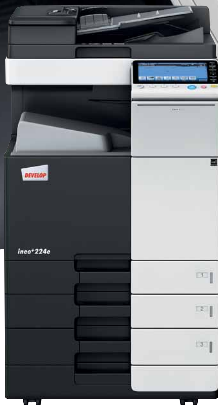
ineo+ 224e mit Papierkassette (PC-210) und Dual Scan Originaleinzug (DF-701)